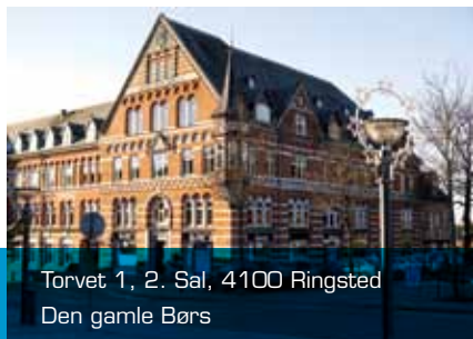
Torvet 1, 2. Sal, 4100 Ringsted Den gamle Børs