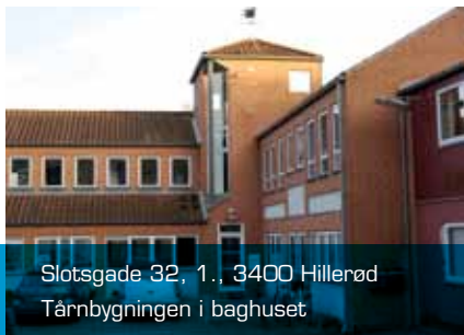
Slotsgade 32, 1., 3400 Hillerød Tårnbygningen i baghuset