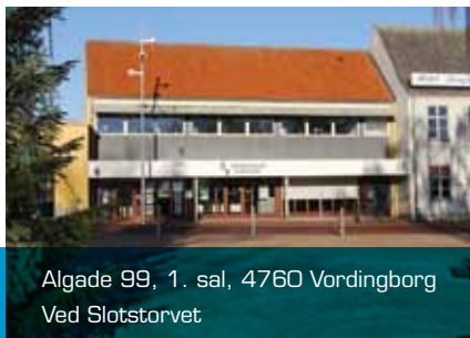
Algade 99, 1. sal, 4760 Vordingborg Ved Slotstorvet