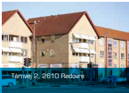
Tårnvej 2, 2610 Rødovre